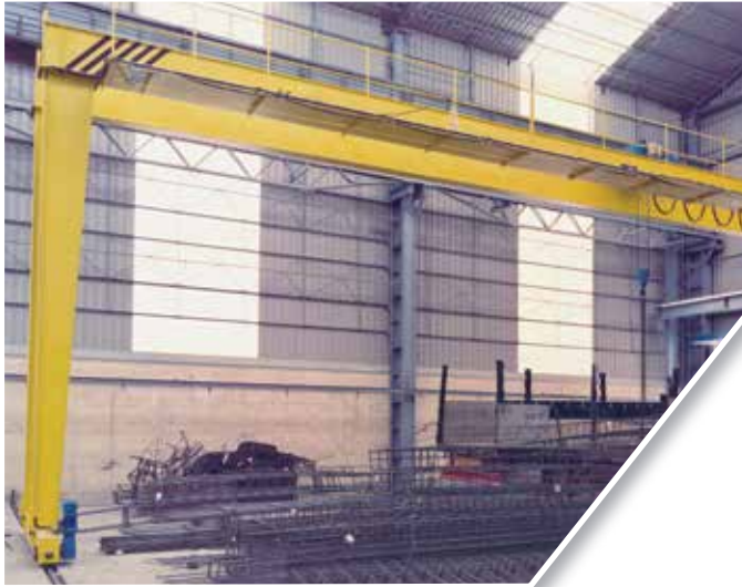
5 t 21 m de luz 7 m de altura 5 t 21 m span 7 m height