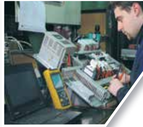
Cableado de cuadro eléctrico Control panel wiring