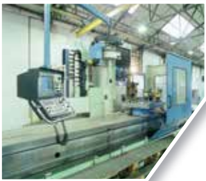
Mecanizado de testeros End carriages machining