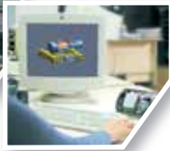
Departamento de I+D R&D Department