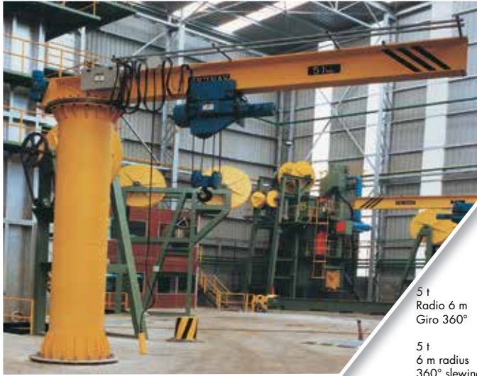
5 t Radio 6 m Giro 360° 5 t 6 m radius 360° slewing

Son elementos auxiliares de manutención.