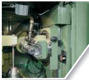
Tallado de engranes Gears machining