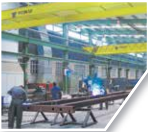
Calderería Welding construction