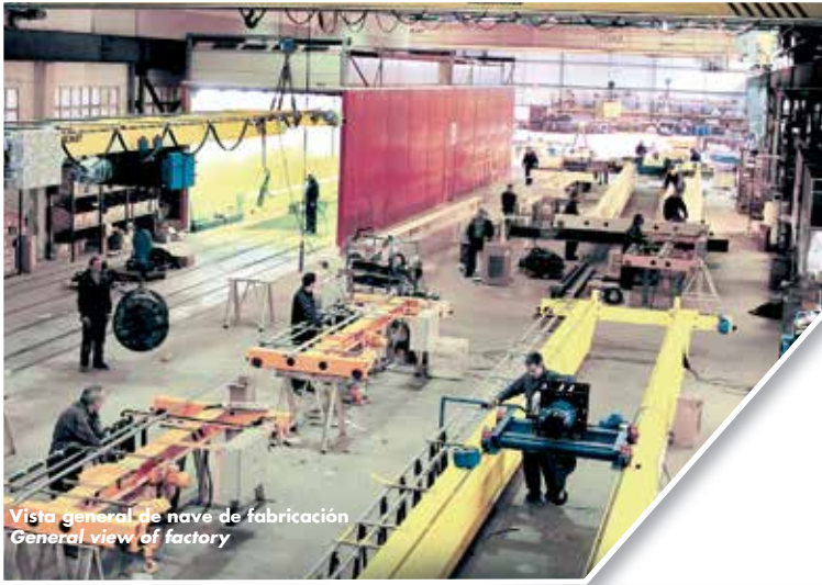
Vista general de nave de fabricación General view of factory