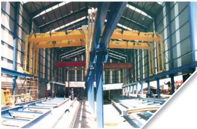
Pórtico bicarril Double girder gantry crane

Other capacities and dimensions can be offered under request.