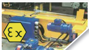
Grúas y polipastos antideflagrantes Explosion proof cranes and hoists