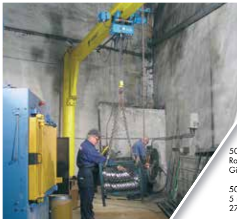
500 kg Radio 5 m Giro 270°

Special protection for jib cranes to work at seaside.