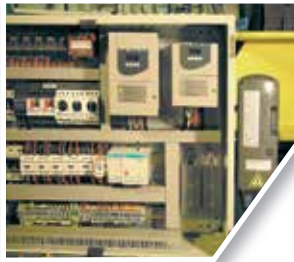
Mando por radio Remote controller