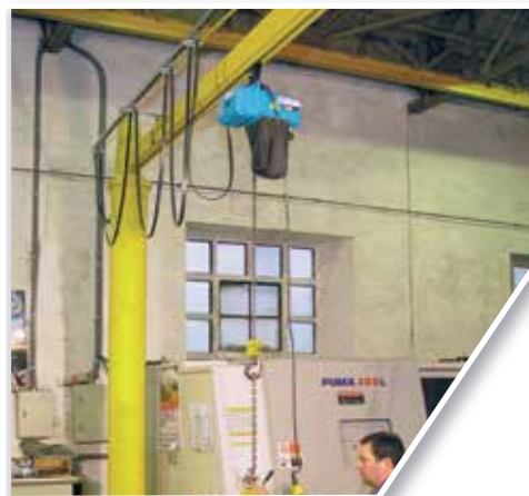
250 kg Radio 3 m Giro 360°