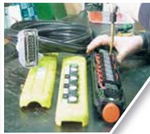
Cableado de botonera Pendant control wiring

Más de 100 años de experiencia, y servir con absoluta eficiencia a los mercados nacionales e internacionales más exigentes han hecho posible que CEMVISA VICINAY sea reconocida como una de las más importantes en cuanto a capacidad de producción, servicio y atención al cliente. Nuestra dimensión de empresa y la profesionalidad de nuestro equipo humano posibilitan la realización del proceso de fabricación y puesta en marcha de los equipos de elevación. Todo este proceso es controlado de manera que se asegura la calidad en todas sus fases, consiguiendo los objetivos de satisfacción del cliente.