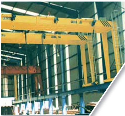
10 t 10 m de luz 7 m de altura 10 t 10 m span 7 m height

Los semipórticos pueden ser monocarriles o bicarriles, dependiendo de las cargas, medidas, gálibos, geometría de la nave, etc.