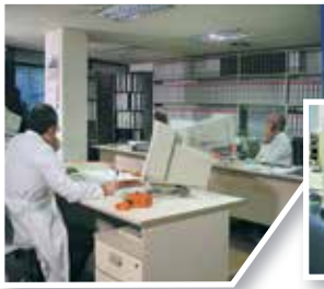
Estaciones de trabajo Work stations