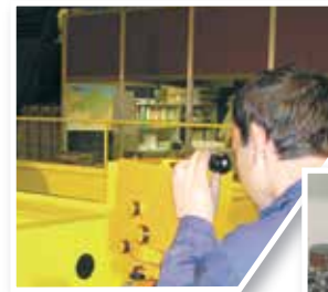
Control de Calidad Quality Control